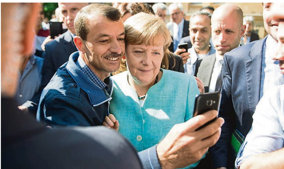
Merkels „kürzeste und beste Rede“ nennt Gert Heidenreich den Auftritt der Kanzlerin am 30. August vergangenen Jahres, als sie die Grenzen für Menschen in Not öffnete. Unser Foto zeigt die CDU-Politikerin mit einem Flüchtling am 10. September 2015 in einer Erstaufnahmeeinrichtung für Asylbewerber in Berlin.